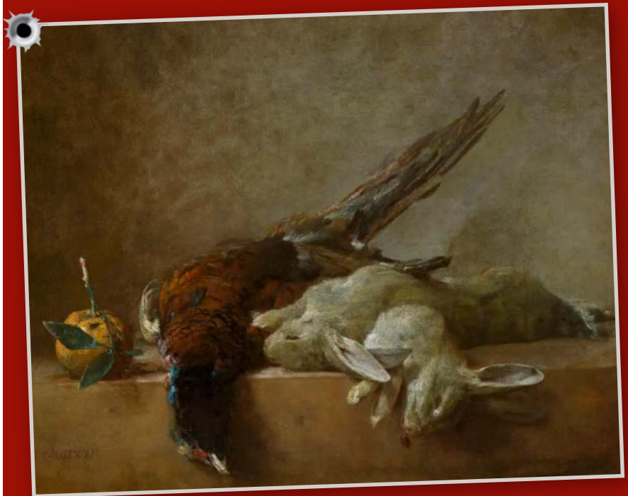
Jean Baptiste Siméon Chardin (Parigi 1699 – 1779): Conigli e fagiano (Natura morta con selvaggina) – 1750. Olio su tela, cm 49,6 x 59,4. Galleria nazionale d'arte a Washington D. C.

no stati trovati microbi vivi che risalgono a ben 2 miliardi di anni fa. La scoperta ha cambiato il nostro modo di vedere la resilienza della vita e ridefinisce i confini della sopravvivenza. Fino a oggi l'ambiente più antico in cui erano stati trovati microrganismi viventi era un deposito di 100 milioni di anni sotto il fondale oceanico.