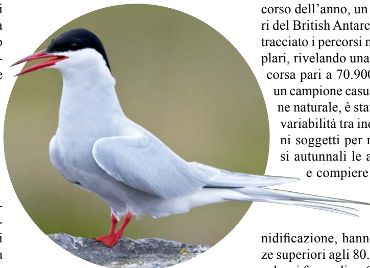
STERNA ARTICA ( STERNA PARADISAEA )

D alla Groenlandia al Mare di Weddell, in Antartide, andata e ritorno. Si tratta del percorso migratorio più lungo mai scoperto finora. Il protagonista di questo incredibile viaggio è la Sterna artica o Sterna codalunga ( Sterna paradisaea ), che nidifica sulle coste artiche e trascorre i mesi invernali a ridosso dell'Antartide. Sebbene fossero note le grandi capacità di volo e le lunghe distanze percorse da questa specie, non si credeva che la Sterna artica potesse compiere una migrazione tanto lunga. Grazie all'applicazione di geolocalizzatori miniaturizzati (1,4 g di peso), che hanno consentito la rilevazione della posizione degli individui su cui sono stati montati durante il