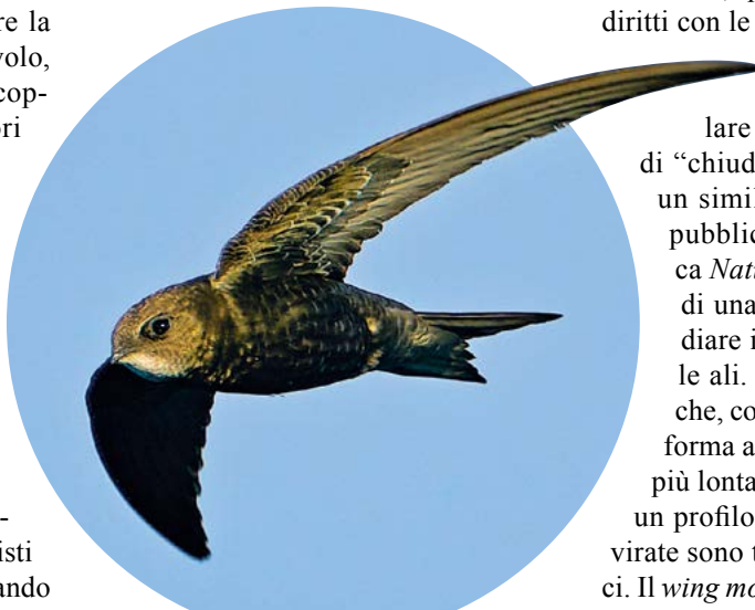
RONDONE ( APUS APUS )

di "chiudere" le ali per guadagnare un simile vantaggio. Una ricerca, pubblicata dalla rivista scientifica Nature , si è basata sull'utilizzo di una galleria del vento per studiare il profilo aerodinamico delle ali. Da questo studio è emerso che, con le opportune correzioni di forma alare, possono volare il 60% più lontano e il 100% più a lungo di un profilo d'ala "fisso" e che le loro virate sono tre volte più precise e veloci. Il wing morphing è studiato anche dagli scienziati americani della Nasa per lo sviluppo di aeromobili.