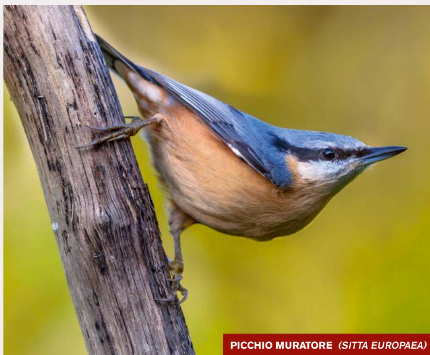
PICCHIO MURATORE ( SITTA EUROPAEA )

l'ausilio di fango, è abitudine della specie europea. Il Picchio muratore corso lascia il foro naturale. A proposito di questa specie gli ornitologi Bricchetti e Di Capi negli anni Ottanta eseguirono studi dettagliati sul legame della specie con il larice ( Pinus laricio corsicana ), una pianta che compone le foreste presenti in Corsica dagli 800 ai 1600 metri di quota, e scoprirono la grande importanza di questo legame evidenziato da una operazione di rimozione di tronchi avvenuta nella foresta di Valdo, la cui conseguenza fu la diminuzione del 60% della popolazione nidificante di picchi nella primavera successiva. Un elemento che cominciò ad essere preso in considerazione, in virtù del fatto che proteggere questi ambienti significava e significa, ancora oggi, proteggere